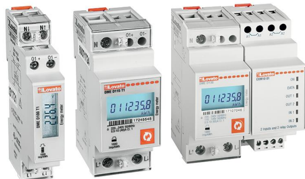
DME-D100 T1 DME-D115 T1 DME-D130

MID-Zähler benötigen keine nachträgliche Eichung mit Eichmarke / MID counters do not require subsequent calibration with a calibration mark